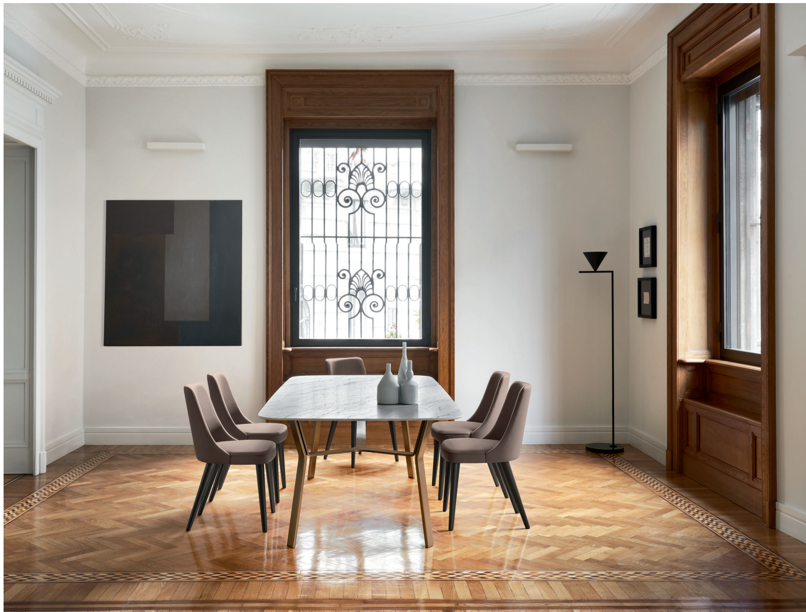
Tavolo Iron L / W 2250 x H 727 x P / D 1140

In totale sintonia con il contesto architettonico d'interni, il tavolo Iron con piano in ceramica e basamento metallico in finitura Bronzo. La ceramica Statuarietto, con le sue rade e sottili venature grigie sul fondo chiaro, impreziosisce il piano dai bordi piacevolmente smussati. Sedie Eva in Rovere Carbone con rivestimento in ecopelle Talpa.