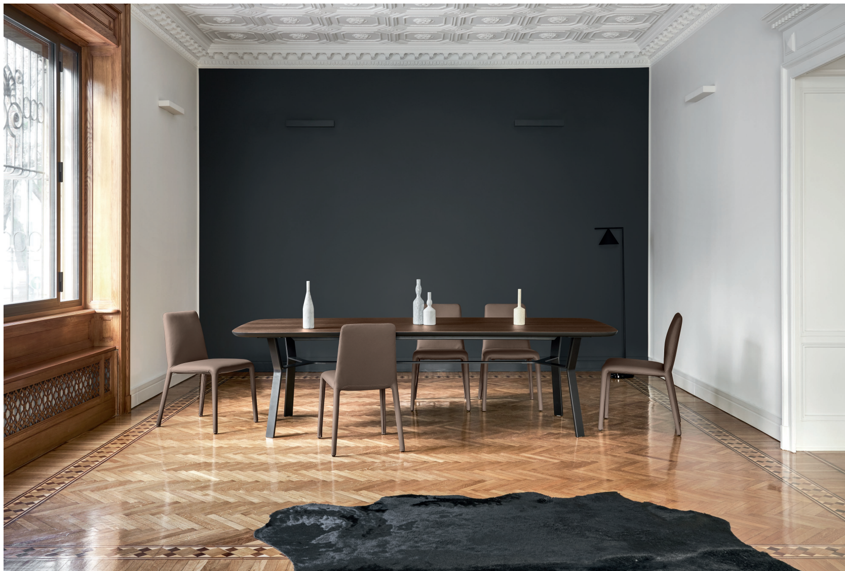
Tavolo Iron L / W 2750 x H 750 x P / D 1140

Dimensioni importanti per questa variante del tavolo Iron: ben 2750 mm di lunghezza per un elemento che caratterizza l'intero spazio circostante. Il top è impiallacciato in Rovere Termotrattato, mentre il sottopiano è in laccato opaco Brown, con basamento metallico in tinta. Le sedie Linda con rivestimento in pelle Marna sono sfoderabili.